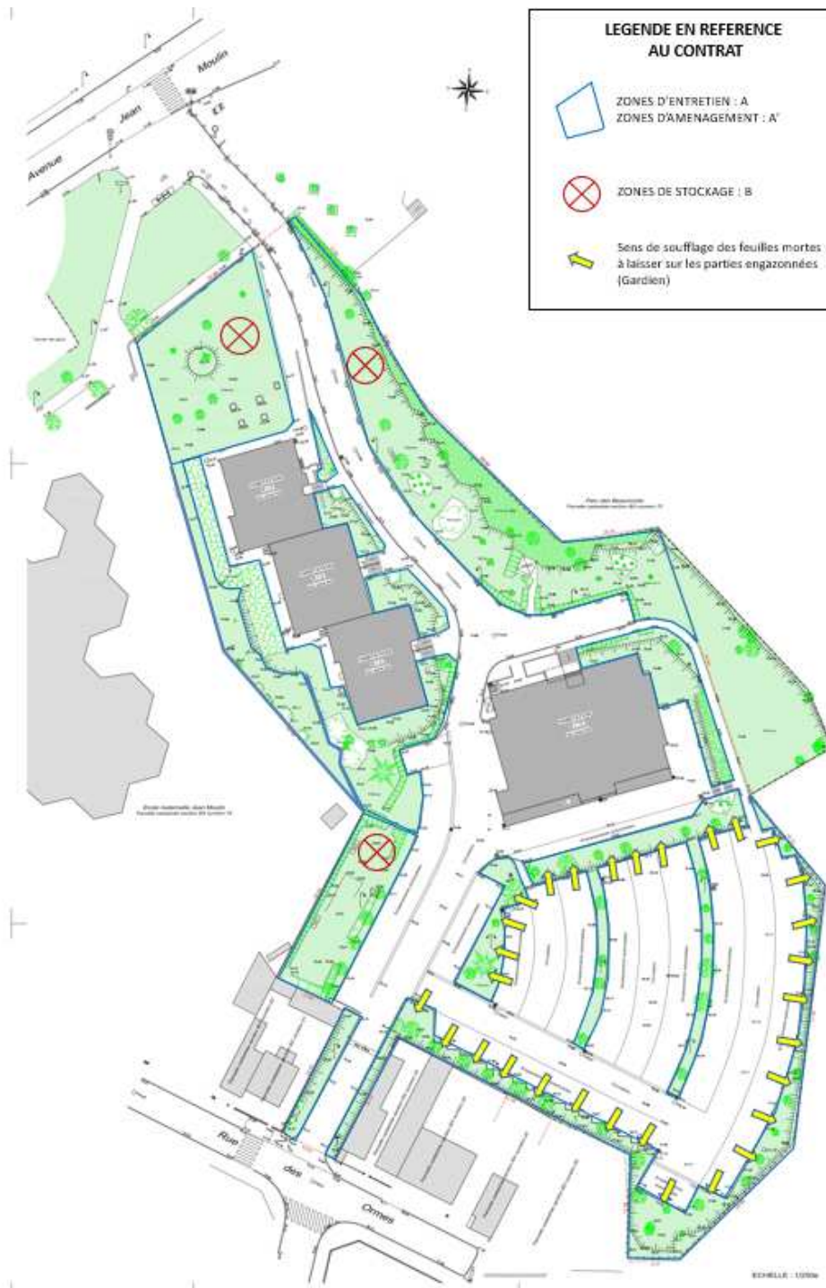
Illustration 1: Plan des espaces extérieurs de la copropriété

1) Ce contrat concerne tous les espaces verts de la copropriété, tels que représentés sur ce plan en vert.